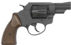
Alarm- und Schreckschusswaffen (mit Schiessbecher gelten diese als Feuerwaffe) sowie Imitationswaffen , wenn die Gefahr einer Verwechslung mit einer Feuerwaffe besteht