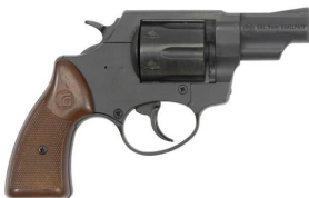
Alarm- und Schreckschusswaffen (mit Schiessbecher gelten diese als Feuerwaffe) sowie Imitationswaffen , wenn die Gefahr einer Verwechslung mit einer Feuerwaffe besteht