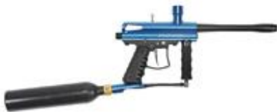
Paintballwaffen (keine Feuerwaffe)