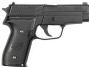
Soft-Air-Waffen (keine Feuerwaffe), die aufgrund ihres Aussehens mit Feuerwaffen verwechselt werden können