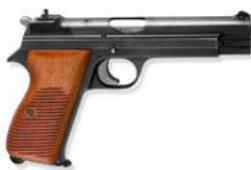
Pistolen, sofern diese nicht mit einer Ladevorrichtung mit hoher Kapazität (mehr als 20 Schuss) ausgerüstet sind